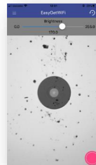
↑ スマートフォンの画面例